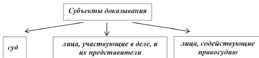
Рис. 5. Субъекты доказывания

При необходимости под рисунком (выше его наименования) приводят поясняющие данные (условные обозначения, масштабные ориентиры и др.). Рисунки должны размещаться сразу после ссылки на них в тексте работы. Первую ссылку обозначают: (рисунок 5), вторую – (см. рис. 5).