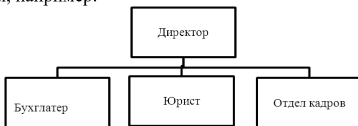
Рис. 1. Организационная структура предприятия

Рисунки нумеруют сквозной нумерацией в пределах всей курсовой работы арабскими цифрами. Каждый рисунок должен сопровождаться подписью, размещают название под рисунком, например: