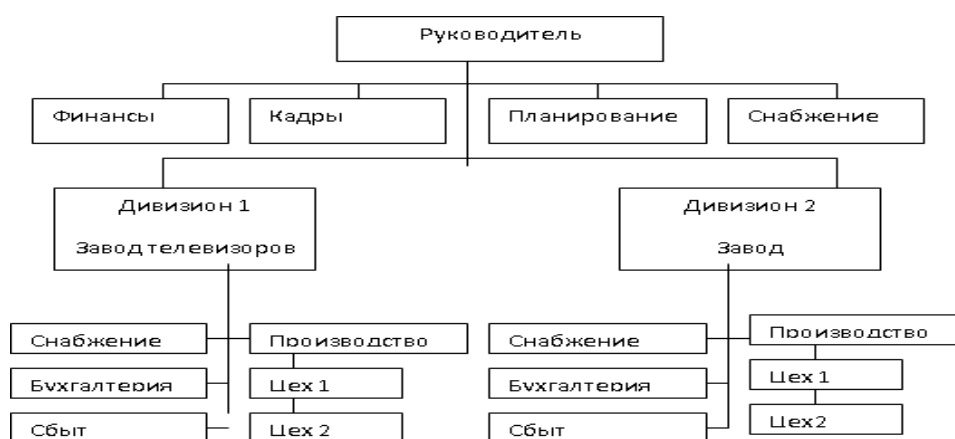
Рис. 5. Организационная структура предприятия

Название иллюстрации всегда начинают с прописной буквы. В конце названия точки не ставят. Размещают название под рисунком, например: