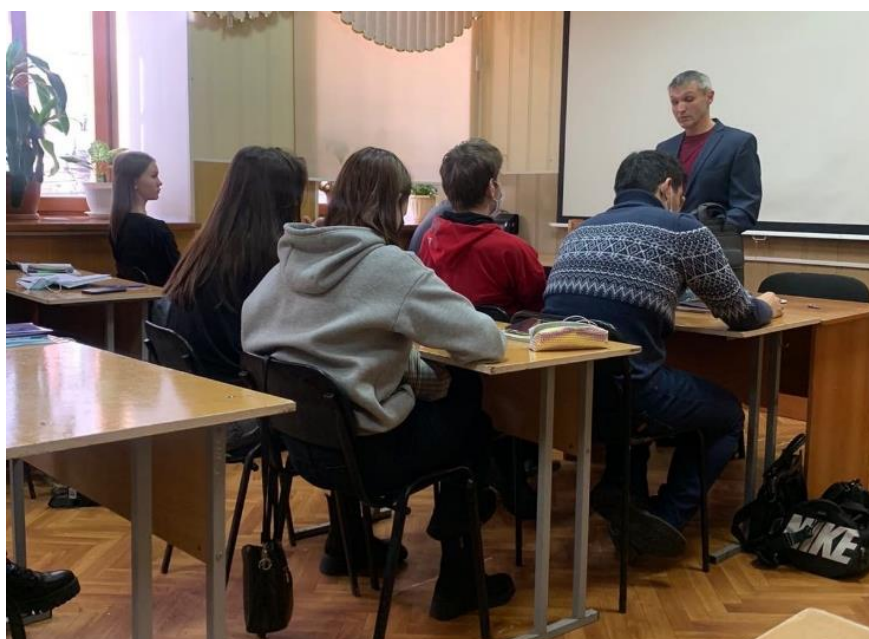
Встреча гр. ПСО-21-7 с сотрудником МВД