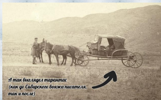
А так выглядел тарантас (как до Сибирского вояжа писателя, так и после)