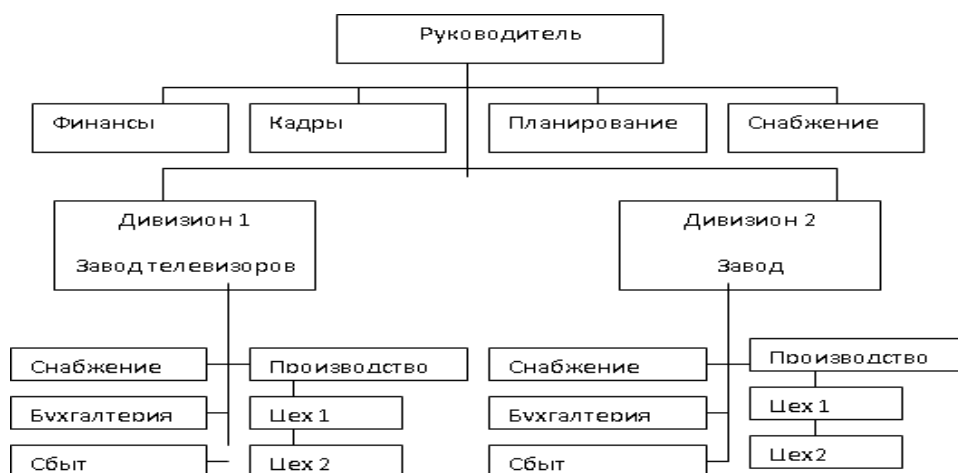
Рис. 5. Организационная структура предприятия

Иллюстрации. Графическое оформление выпускной квалификационной работы может быть представлено в виде графиков, диаграмм, схем и т. п. Все иллюстрации (фотографии, схемы, графики, диаграммы) именуется рисунками. Иллюстрации, как в тексте работы, так и в приложении должны быть выполнены на стандартных листах белой бумаги. Рисунки нумеруют (если их в работе более одного) сквозной нумерацией в пределах всей выпускной квалификационной работы (до приложений к ней) арабскими цифрами. Единственная иллюстрация в работе не нумеруется. Каждый рисунок должен сопровождаться надписью, которая делается с лицевой стороны, и составляется в следующем порядке: – условное сокращение название иллюстрации – «Рис.»; – ее порядковый номер арабскими цифрами; – название иллюстрации. Название иллюстрации всегда начинают с прописной буквы. В конце названия точки не ставят. Размещают название под рисунком, например: